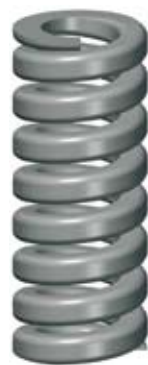
5. Ultrahög belastning Se separat tabell sid. 69.