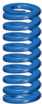
2. Medelstor belastning