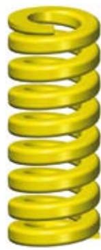
4. Extra stor belastning