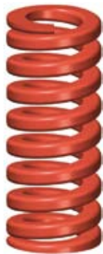
3. Stor belastning