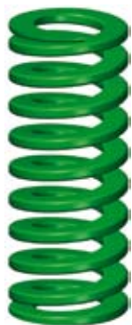
1. Låg belastning